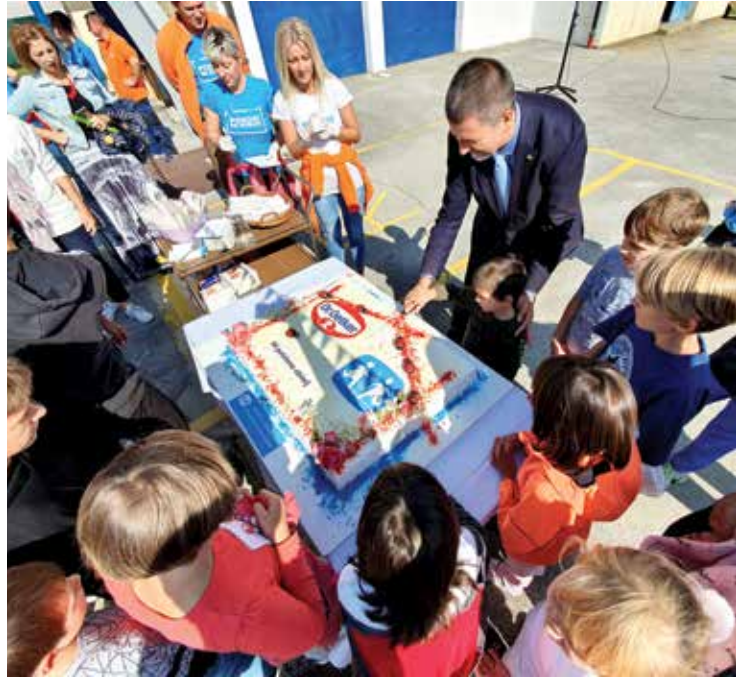
Veselo druženje nastavilo se na otvorenom uz zabavne sportske aktivnosti i kreativne radionice.